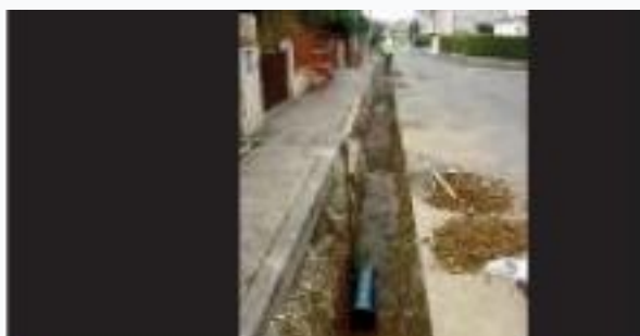
Le réseau public