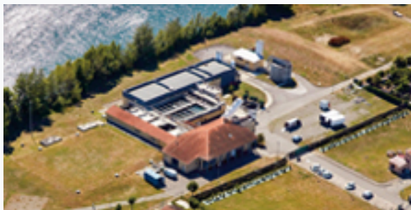
L'usine de production d'eau potable - Roques