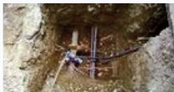
Le domaine privé : canalisation et branchements