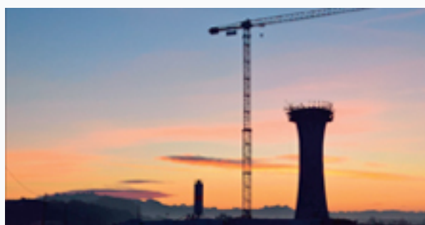
Le stockage de l'eau potable