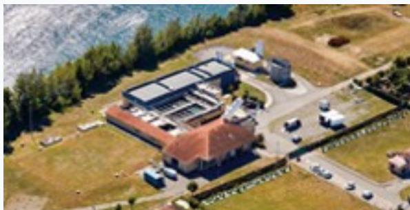
L'usine de production d'eau potable - Roques