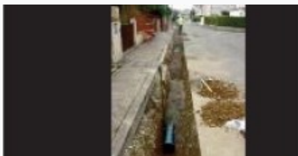
Le réseau public