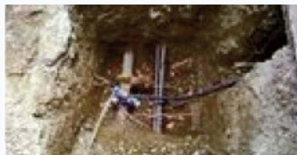
Le domaine privé : canalisation et branchements