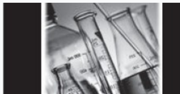
La qualité de l'eau potable

Retrouvez ici notre cahier des prescriptions techniques pour la réalisation de réseaux et de branchements d'adduction d'eau potable