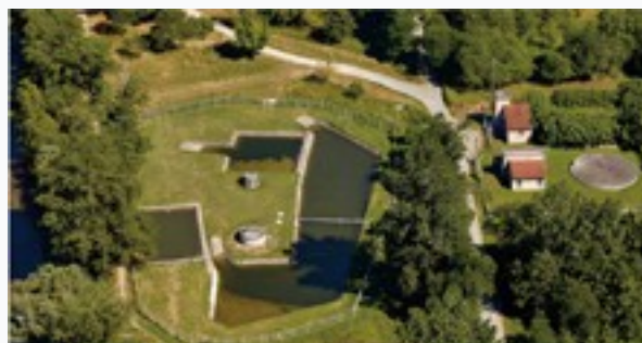
L'usine de production d'eau potable - Pinsaguel